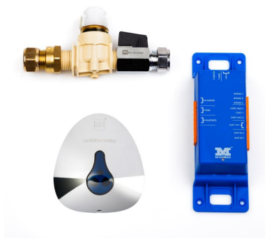
M-Check Urinal infrarood