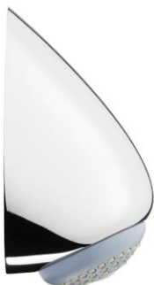
De Melker douchekop