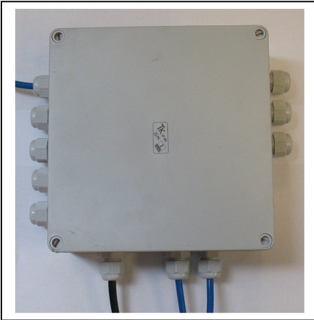
Afbeelding 1: PS

A. Monteer de PS tegen een vlak oppervlak, op een droge en bereikbare plaats