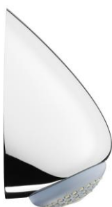
De Melker douchekop