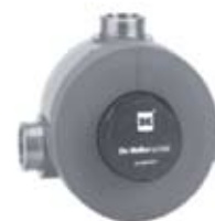
DCM - 10