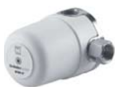
DCM - 5

Uitgaande van een capaciteit van 6 l/min.