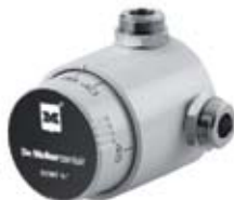
DCM - 7