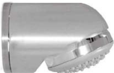
De Melker douchekop DMD.6